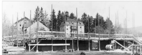
Der Beginn der Bauarbeiten für die Jahnturnhalle, sie wurde schlüsselfertig „hingestellt“.