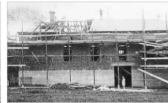
Der Bau der Jahnturnhalle erfolgte durch die Firma Kagerhuber.