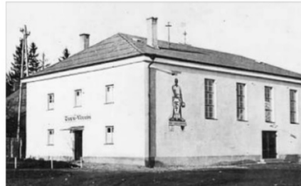
Die Jahnturnhalle nach der Fertigstellung im Jahr 1929.