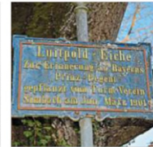
Die Luitpold-Eiche wurde 1920 auf den Jahnplatz „umgepflanzt“. Baum und Schild sind heute noch vorhanden.

chen Veranstaltungen in Simbach, die in der Au und im „Moos“ stattgefunden haben.