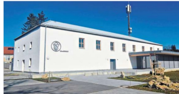
So sieht die Jahnturnhalle heute nach der umfassenden Sanierung aus.